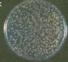
写真-3 大腸菌 対照 30分後 (試験液 0.1 mL)