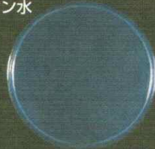
写真-2 大腸菌 検体 30分後 (試験液 0.1 mL)