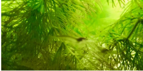
実験用水槽を泳ぐミナミヌマエビ