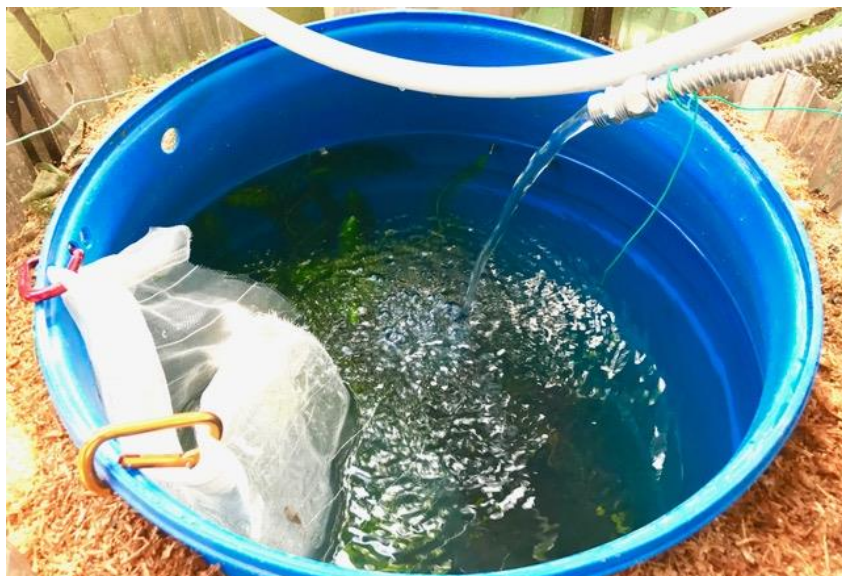
稚エビの生息空間ネット